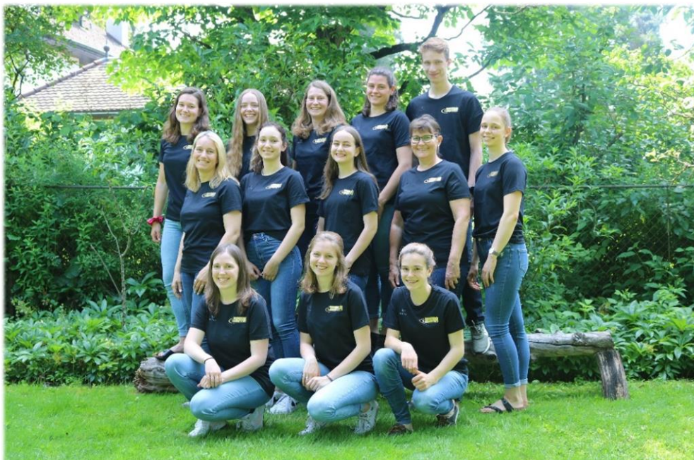
Leiterteam Geräteturnen Sportverein SATUS Oberentfelden